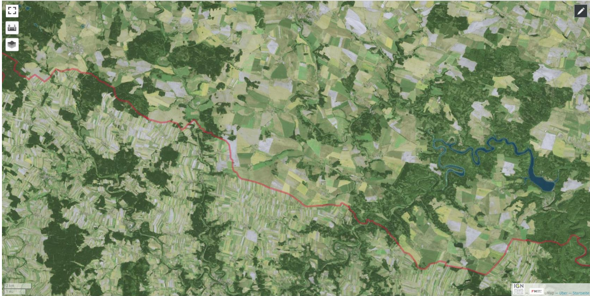
Abbildung 1: Ergebnis Satellitenbild